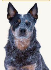
Snjos Blue Ladjiladji "Zack" , 5 år Ägare & Fotograf: Belinda Rubin Tränar huvudsakligen tävlingslydnad och speciellsök