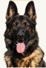
Rapports Olura "Olura", 11 år Korad BSL III, Svensk Schäfermästare BSL III 2012 2014, Segrare Schäferslaget BSL III 2013 2016 Ägare: Kennel Rapports Tränar BSL