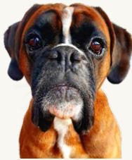
Albinsson's Biffiga Borka "Tango", 5 år Korad SPH III Ägare & Fotograf: Karin Lehrman Tränar spår och tävlingslydnad