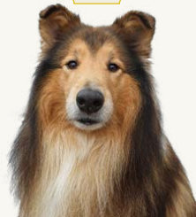
Springmist's Blaze Rod "Ajax", 7 år Korad SPH II Ägare & Fotograf: Elisabeth Bauer Tränar spår, bruks- och lydnadlydnad