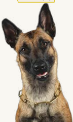
Terrorzone Ärra "Aina", 3 år – LD start, BH/VT, IGP I Ägare: Carina Schibrach Tränar IGP