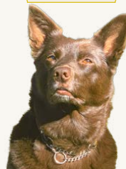
Tarrowangas Bea "Bea" , 7 år Ägare & Fotograf: Lotta Ljungman Stenhardt Tävlats lydnad och bruksspår. Utbildad i speciellsök med inriktning narkotika