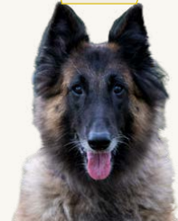
Red Attraction Denyah "Denyah", avliden Ägare: Malin Pontinder

Nyfiken på vilka hundar som stod som modell för bruksraserna i artikeln "Brukshundraserna" i BB1 2021?