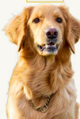
Hova-Vaengets Dana "Dana", 5 år C.I.E, BH, DK Uch, DK JV 2017 Ägare: Klas Widén & Linda Hintz