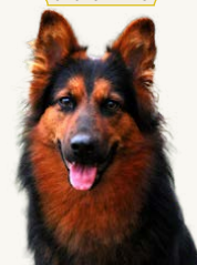
Best Wishes Cheerful Shambala "Pippi", 1 år – Ägare: Anki Mohlin Tränar inför Appellklass spår och Lydnad startklass