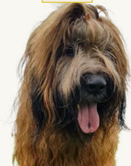
Trésor de Brie Newton Fauve Gi "Newton", 8 år Korad, C.I.E, NO Uch, DK Uch, SK Ch Ägare & Fotograf: Pauline Nord Tävlats lite i spår & lydnad