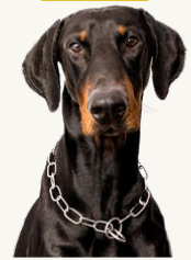
Dobforsport Exor "Exor" , 2 år Ägare & Fotograf: Stig Johansson Störst fokus på lydnadsträning, tränar också spår och skydd. Mål tävla i IGP eller Mondioring