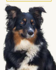
Aymik's Look That Amazes "Blossa", 2 år Ägare & Fotograf: Lena Eklund Tränar lydnad och spår, uppflyttad till Lydnad klass I, testat på vallning