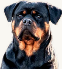
Siderotts Bus "Bästa Buson", 2 år – JV Estland & Lettland Ägare: Yvonne & Ellinor Andersson Tränar bruksspår, lydnad, rallylydnad