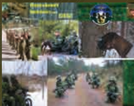
Hemvärnet behöver dig och de söker ständigt nya hundekipage.