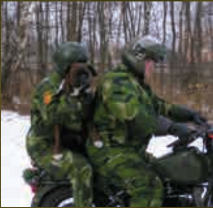
Tricky har fått vara med på många äventyr i sin tjänst som bevakningshund.