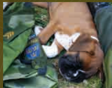
Det gäller att börja i tid. Elrond fick följa med Eva på jobbet redan som valp.

ett antal platser runt om i landet med tre alternativa kursformer: