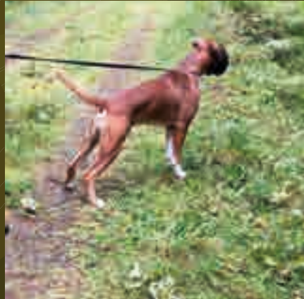
Elrond markerar med kroppspråket att det finns "fiende" i skogen.