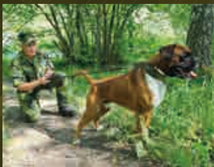
Något händer i skogen. Elrond markerar direkt mot källan.